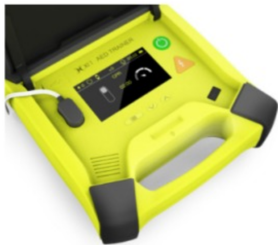
Informacja zwrotna na kolorowym ekranie realistycznym na temat wykonywanych ćwiczeń