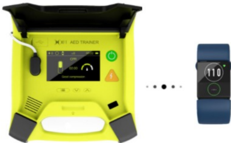
Bezprzewodowa komunikacja między trenerem a opaską CPR odnośnie jakości wykonywanych ćwiczeń